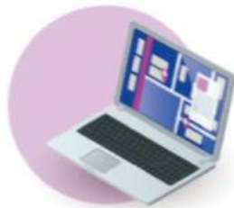
FREIGHT FORWARDING AND LOGISTICS COMPANIES