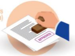
FINAL CONSIGNEE ESTABLISHED IN THE EU