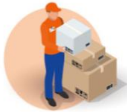
POSTAL OPERATORS INSIDE AND OUTSIDE THE EU