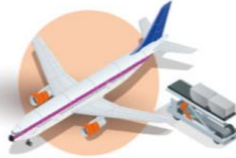
AIR CARGO CARRIERS