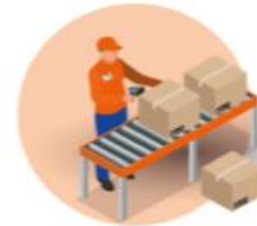
REPRESENTATIVES OF ALL AFFECTED EOs